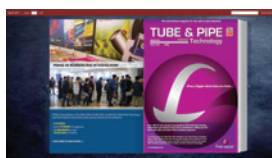
Opzione 2 Copertina Interna